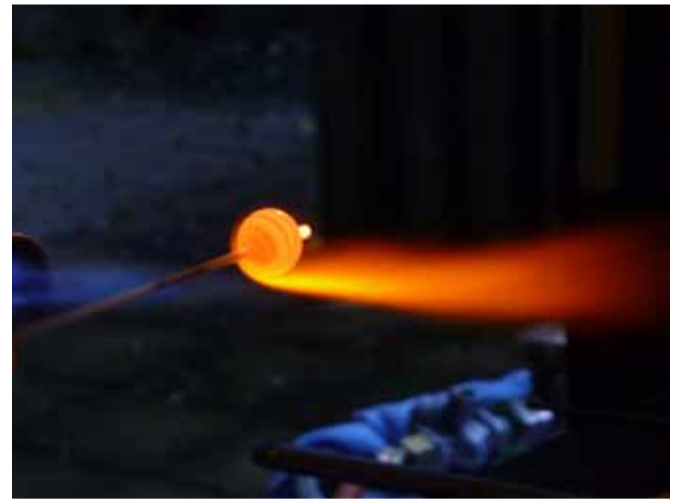
Rund schmelzen, formen, verzieren