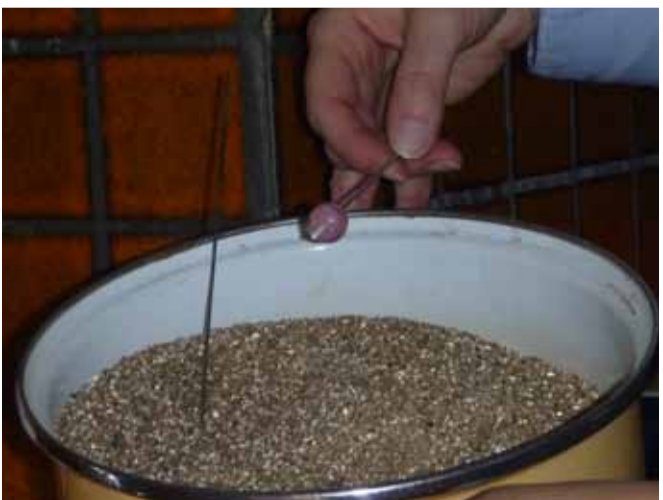
Langsam abkühlen lassen