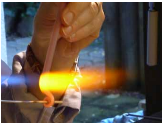
Flüssiges Glas um den Dorn wickeln